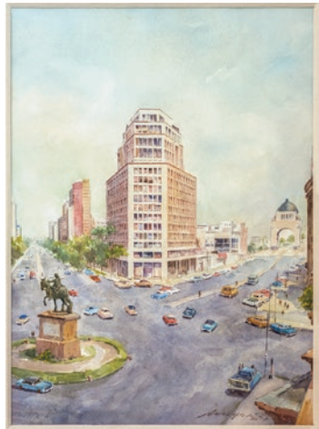
Reforma 1. 1947-1957.