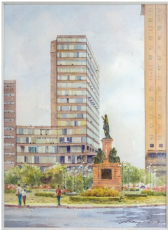
Reforma 76. 1957-1986.