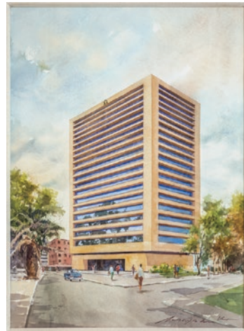
Campos Elíseos 345. 1986-actual.